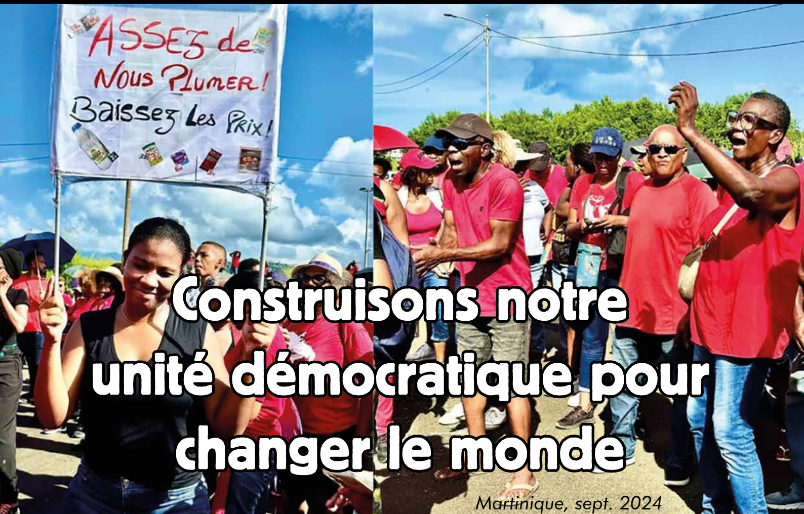
Martinique, sept. 2024

Contre la guerre d'Israël aux Palestiniens et aux populations du Moyen-Orient